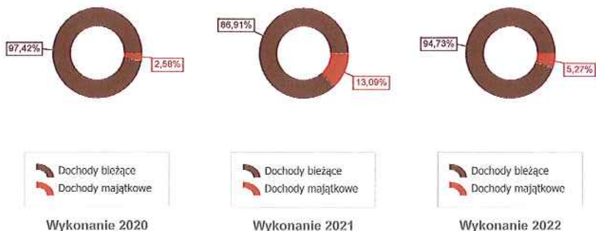
Wykres 1: Struktura dochodów ogółem Gminy Gdów w 2022 w porównaniu do lat 2020-2021.